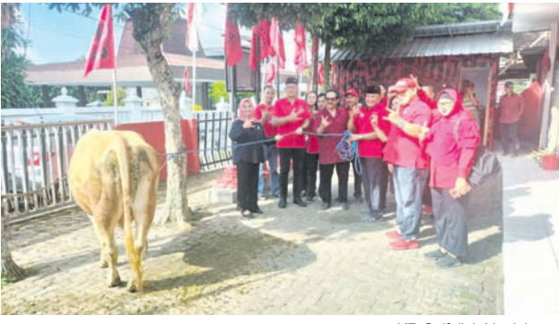
Bupati dan Wakil Bupati Sleman secara simbolis menyerahkan satu ekor sapi ke DPD PDI Perjuangan.