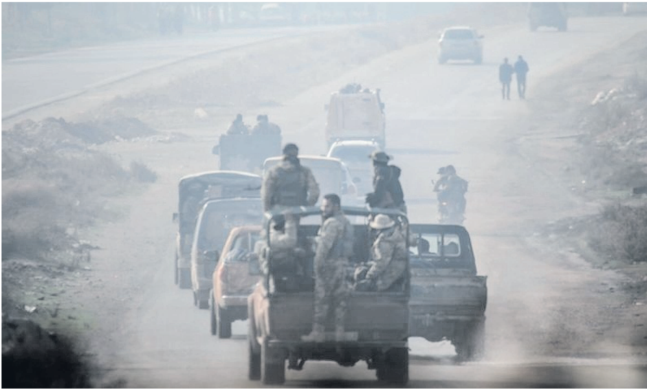
Kelompok bersenjata antirezim Bashar Al-Assad dilaporkan mulai memasuki Damaskus dari sisi Selatan Ibu Kota Suriah pada Sabtu (7/12/2024). Kelompok itu memasuki wilayah Damaskus Tengah seiring keberhasilan mereka merebut pusat kota Quneitra di Barat Daya Suriah, demikian menurut sumber setempat.

DAMASKUS (KR) - Rezim Baath Suriah akhirnya runtuh, digulingkan oposisi, Minggu (8/12). Berakhirnya era keluarga Assad ditandai warga Suriah dengan merobohkan patung Hafez al-Assad, mendiang ayah dari Presiden