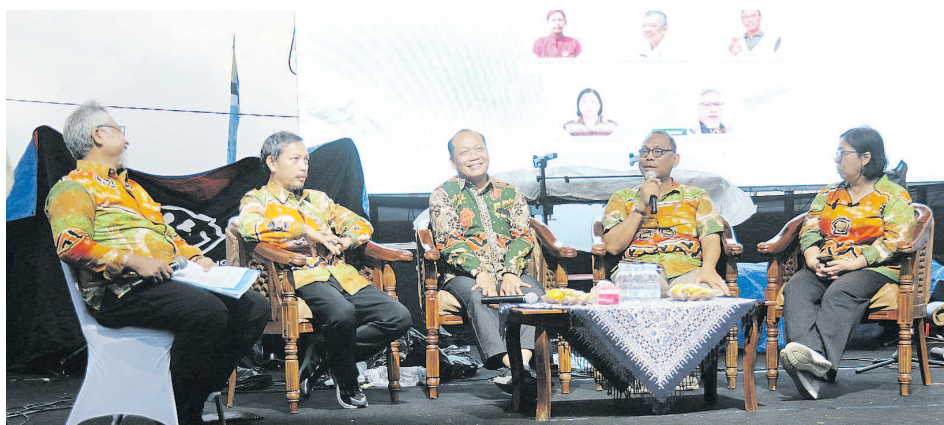
Peserta melihat layar monitor yang menampilkan hasil persentase penghitungan suara saat rapat pleno rekapitulasi hasil penghitungan perolehan suara dan penetapan hasil Pilgub di Jakarta, Minggu (8/12/2024).

JAKARTA (KR) - Komisi Pemilihan Umum (KPU) DKI Jakarta menetapkan pasangan calon (paslon) Gubernur dan Wakil Gubernur nomor urut 3, Pramono Anung-Rano Karno atau Si Doel meraih suara terbanyak dalam Pilkada Jakarta 2024 yakni 2.183.239 suara.