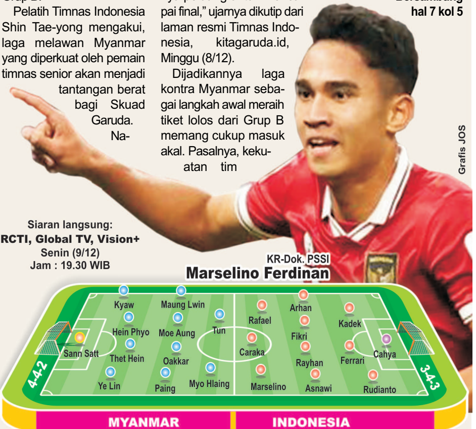
Siaran langsung: RCTI, Global TV, Vision+ Senin (9/12) Jam : 19.30 WIB