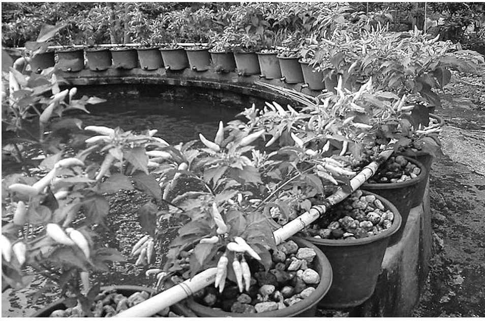
Kebun akuaponik memadukan kolam lele dengan tanaman cabai.

Siklus dalam proses akuakultur, ada sisa pakan yang dihasilkan ikan dalam bentuk feses yang terakumulasi di dalam air. Feses dengan kandungan nitrat dan amonia ini bersifat toksin atau beracun bagi