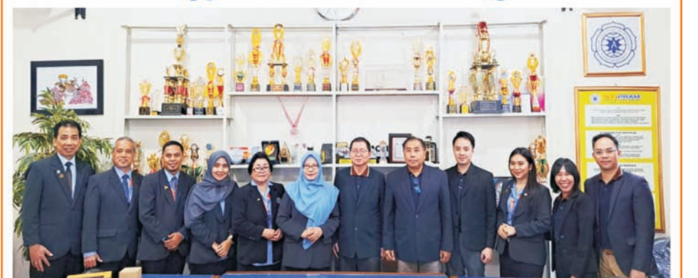
Delegasi RUMTL dan STIPRAM berfoto bersama sesuai penerimaan kedatangan ke STIPRAM

YOGYA (KR)- Merdeka Belajar, Kampus Merdeka(MBKM) adalah program yang dicanangkan pemerintah pada masa pandemi Covid-19. STIPRAM Yogya telah mengikuti program ini sejak beberapa tahun lalu dengan berbagai program. Salah satu program internasional unggulan di STIPRAM adalah program pertukaran mahasiswa dan dosen (student and lecturer exchange). "Saat ini, delegasi dari Rajamangala University Thailand, yang terdiri dari Wakil Presiden, Dekan, Kaprodi, 2 Dosen dan 5 mahasiswa mengunjungi STIPRAM dalam rangka realisasi program student and lecturer exchange.