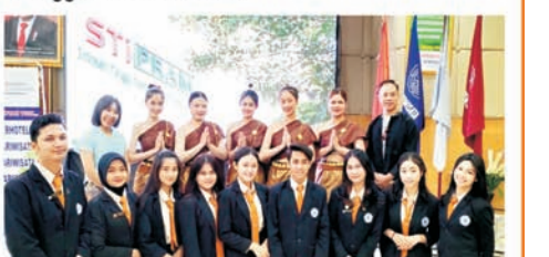
Pertukaran budaya antara mahasiswa RUMTL dan STIPRAM sebagai bagian dari program MBKM

"Sebagai kunjungan balasan, STIPRAM akan mengirimkan 17 mahasiswa dan 3 dosen ke kampus RMUTL Thailand pada bulan Juli 2023 mendatang. Mereka nanti akan mengikuti agenda serupa saat berada di Thailand," terang Damiasih.