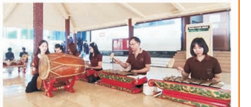
Dosen dan mahasiswa dari RUMTL Thailand belajar menggemel di STIPRAM

Menurut Damiasih, selain beberapa kegiatan di atas, saat di kampus, peserta belajar memainkan alat musik tradisional gamelan dipandu UKM Gamelan dan belajar menari tari tradisional Yogyakarta dipandu UKM tari STIPRAM. Tampak para peserta sangat antusias belajar memukul alat musik gamelan ini bertempat di kampus STIPRAM. Untuk pemantapan dan kontinuitas program tersebut, delegasi RMUTL Thailand dan STIPRAM yang digawangi oleh Kantor Urusan Internasional (KUI) melakukan diskusi dan koordinasi mengenai kelanjutan program kolaborasi antara STIPRAM dan RMUTL Thailand di masa mendatang.