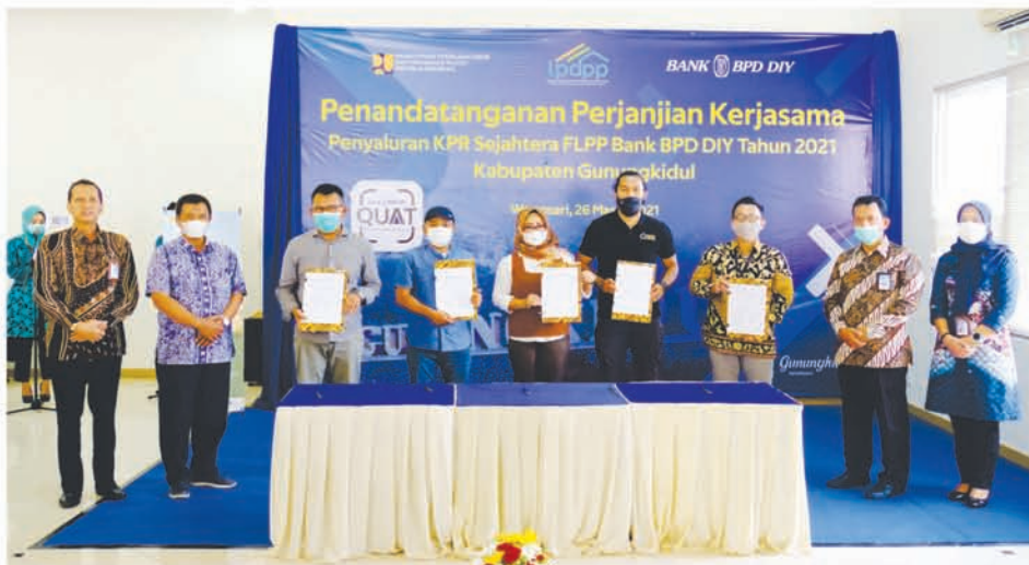
Penandatanganan kerjasama dengan lima pengembang di Gunungkidul oleh Pemimpin Cabang Wonosari disaksikan oleh Direksi Bank BPD DIY dan Kepala Dinas PUPR Kab. Gunungkidul

WONOSARI, 26 Maret 2021 – Bank BPD DIY kembali ditunjuk sebagai bank penyalur Kredit Pemilikan Rumah bersubsidi Fasilitas Liquiditas Pembiayaan Perumahan (KPR FLPP) oleh Kementerian Pekerjaan Umum (PU) Perumahan Rakyat & Kawasan Pemukiman (PUPRKP). Menyikapi hal tersebut, Bank BPD DIY menandatangani perjanjian kerjasama dengan lima pengembang perumahan di wilayah Gunungkidul pada Jum'at (26/3) di Kantor Cabang Wonosari.