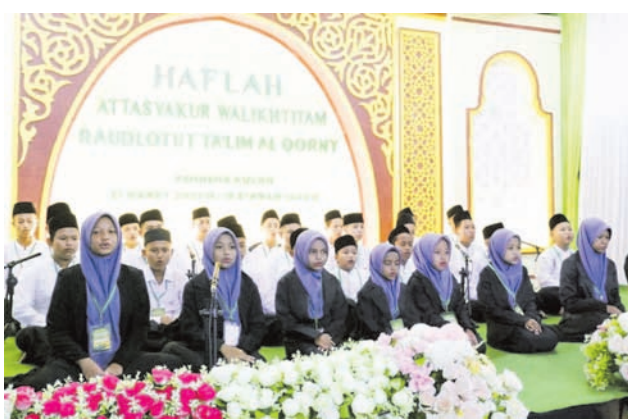
Prosesi khataman di RTA Rendeng Kulon Sewon Bantul. KR-Istimewa