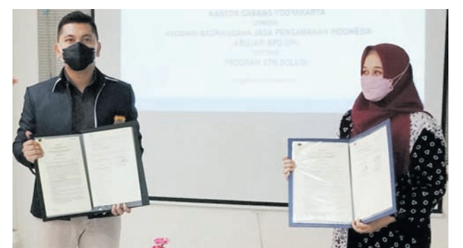
Penandatanganan kerja sama antara Bank BTN KC Yogya dan Abujapi BPD DIY. KR-Devit Permata

Dyah Respati Woro Haniswari menuturkan, kerja