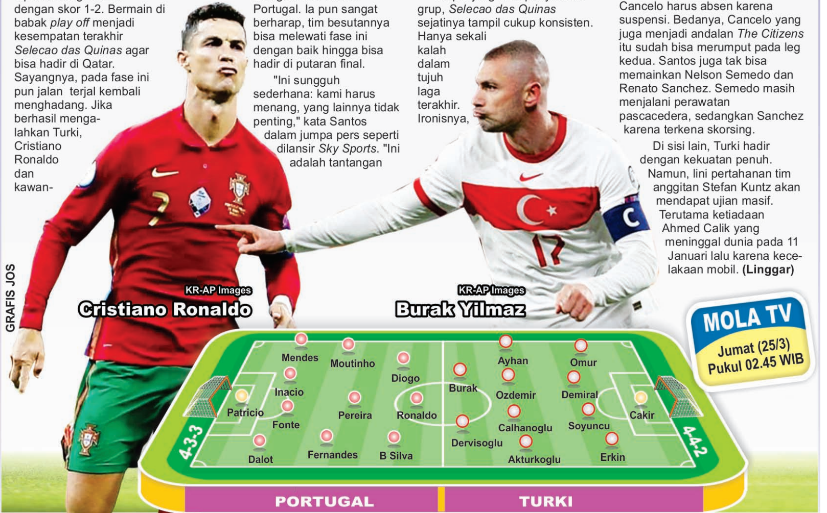
Cristiano Ronaldo