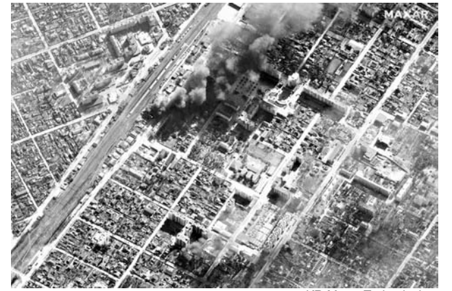
Citra satelit menunjukkan kerusakan setelah bombardemen Rusia di kota Irpin.

AS memperkirakan Rusia menempatkan lebih dari 150.000 tentara di sekitar Ukraina sebelum invasi 24 Februari, bersama