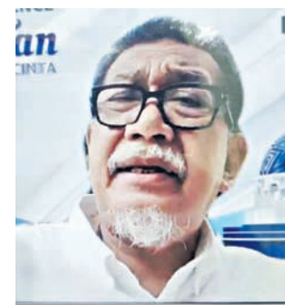
Pemain Para Pencari Tuhan.

Selain itu ada kejutan menarik Ramadan tahun ini, ujarnya, yakni akan dibagikan 4 rumah bagi penonton SCTV. Bekerja sama dengan tim Mandala Shoji menurut Banardi, Rumahku Istanaku akan membagikan kebahagiaan kepada mereka yang membutuhkan rumah hunian dengan memberikan satu unit rumah siap dihuni di setiap episodenya.