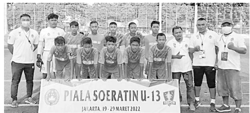
Tim PS Protaba U-13 sebelum bertanding di Piala Soeratin U-13 Nasional.